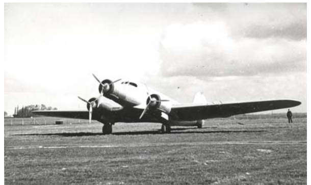
Le R-35 « stratosphérique » avant son vol fatidique du 1er avril 1938.