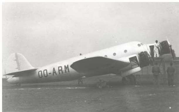
Derniers réglages des moteurs du R-35; la confiance et l'intérêt du motoriste pour le projet étaient tels qu'il céda les trois moteurs en prêt.