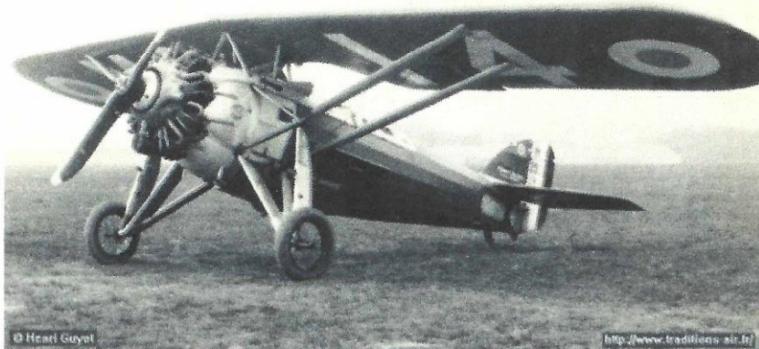
Morane-Saulnier MS 230

tionnel dans l'armée de l'air et l'aéronautique navale françaises jusqu'en 1935 ( Cet avion est visible au Musée royal de l'Armée à Bruxelles ). De son succès, naissent des versions améliorées comme les 'MS137, MS138, MS139 et MS230'. Produit à plus de mille exemplaires, le 'MS230' deviendra, grâce à son extraordinaire maniabilité, sa robustesse et sa fiabilité, l'appareil d'entraînement et de voltige le plus populaire dans la période de l'entre-deux-guerres.