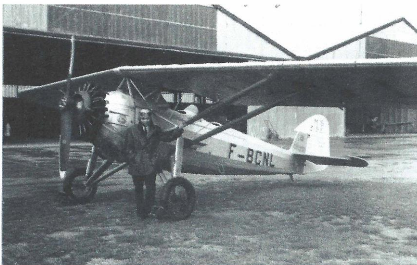
Morane-Saulnier MS 230

train de roues est équipé de freins hydrauliques. Cette dernière série clôturera la série des avions Morane-Saulnier à aile parasol.