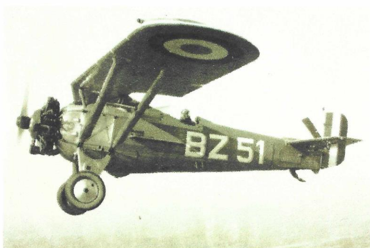
Morane-Saulnier MS 130

1914 est aussi l'année où seront fabriquées les versions 'type LA et P'.