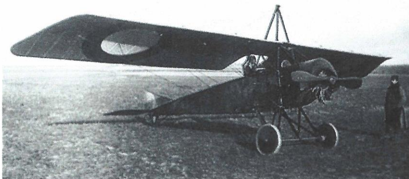
Morane-Saulnier 'type L'

parle d'avions MS ( Morane-Saulnier ), on pense 'Aile Parasol'. L'armée turque passe commande pour une cinquantaine d'avions. Réputé pour sa facilité à être piloté, son agilité, sa vitesse et sa robustesse, le 'type L', sera commandé, en 1914, à plus de six cents exemplaires, par les forces aériennes françaises, britanniques et russes.