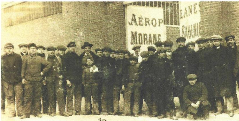
Ouvriers de Morane-Saulnier devant le portail de la rue Volta - 1911

Créée en 1911 par Léon Morane, son frère Robert et Raymond Saulnier, la firme Morane-Saulnier prend de plus en plus d'ampleur : sur près de cinquante ans, de leurs ateliers situés au n° 3 de la rue Volta à Puteaux, non loin de Paris, sortiront plus de septante prototypes et