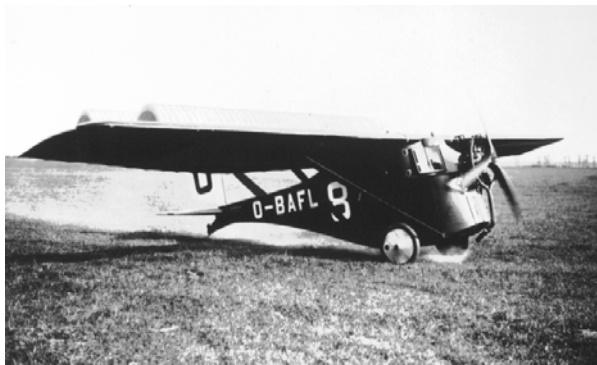
Le Sabca DP à Orly (AELR)

Très vite, il est modifié pour recevoir un moteur Anzani de 50 CV refroidi par air, beaucoup plus léger. C'est ainsi équipé qu'il remporte le concours d'avionnettes de Vauville en 1924. La SABCA qui le faisait déjà participer aux concours sous ses couleurs le rachète à ses propriétaires et concepteurs le 23 octobre 1925. Depuis lors, c'est sous le nom de SABCA-D.P. qu'il poursuivra sa carrière.