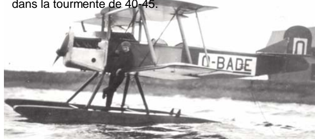
L'unique RSV 26-180 amphibie lors d'une de ses premières mises à l'eau en 1927, probablement au bassin de chasse du port d'Ostende. (AELR)

Déclassés en 1935 par les militaires, 10 RSV 26-180 furent vendus à des civils en octobre et reçurent les immatriculations OO-PAF/ARA/ARB/ARC/ARE/ARO/ARP/ARQ/ARS et ART. Trois de ceux-ci furent acquis par le pilote et constructeur bruxellois Georges Dassy et 6 par une certaine Mme Adrienne Roovers de Bruxelles. La plupart de ces machines disparurent dans la tourmente de 40-45.